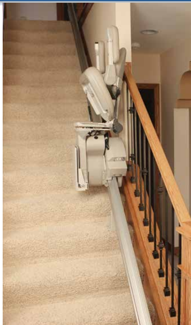
Diseño compacto para espacios abiertos en escaleras.